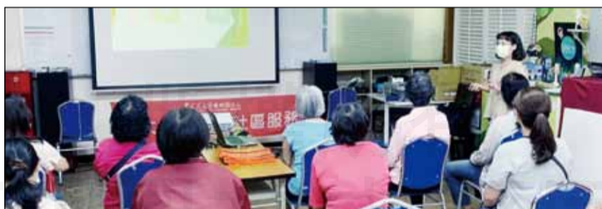
↑藥師參與社區衛教講座，民眾反應熱烈。

這次社區衛教講座於高雄左營區的菜公里民活動中心，參與的民眾年齡約介於50歲到70歲。藥師針對偏高的年齡層安排四大實用主題，分別是高血壓與高血