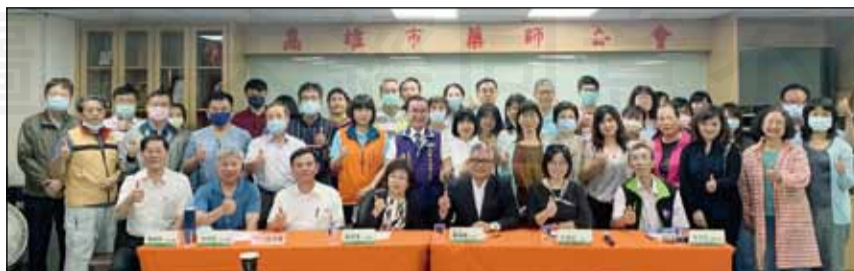
↑藥師公會全聯會於4月18日舉辦「110年度藥師公會全聯會診所藥師委員會南區共識營講座」。

一、實名制口罩至今已一年多，社區藥局協助政府全力投入防疫，讓藥師的專業角色與價值在公共衛生領域上，被政府與民